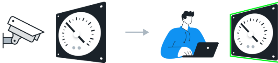
カメラでメーターを撮影