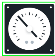
自動で画像を補正し正確な数値を読み取ります